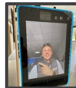
Double Assistant technique de Cruzr Mise en relation par visio conférence avec le dirigeant