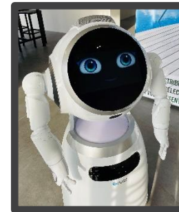
Cruzr Assistant de visite Accueil clientèle Devis